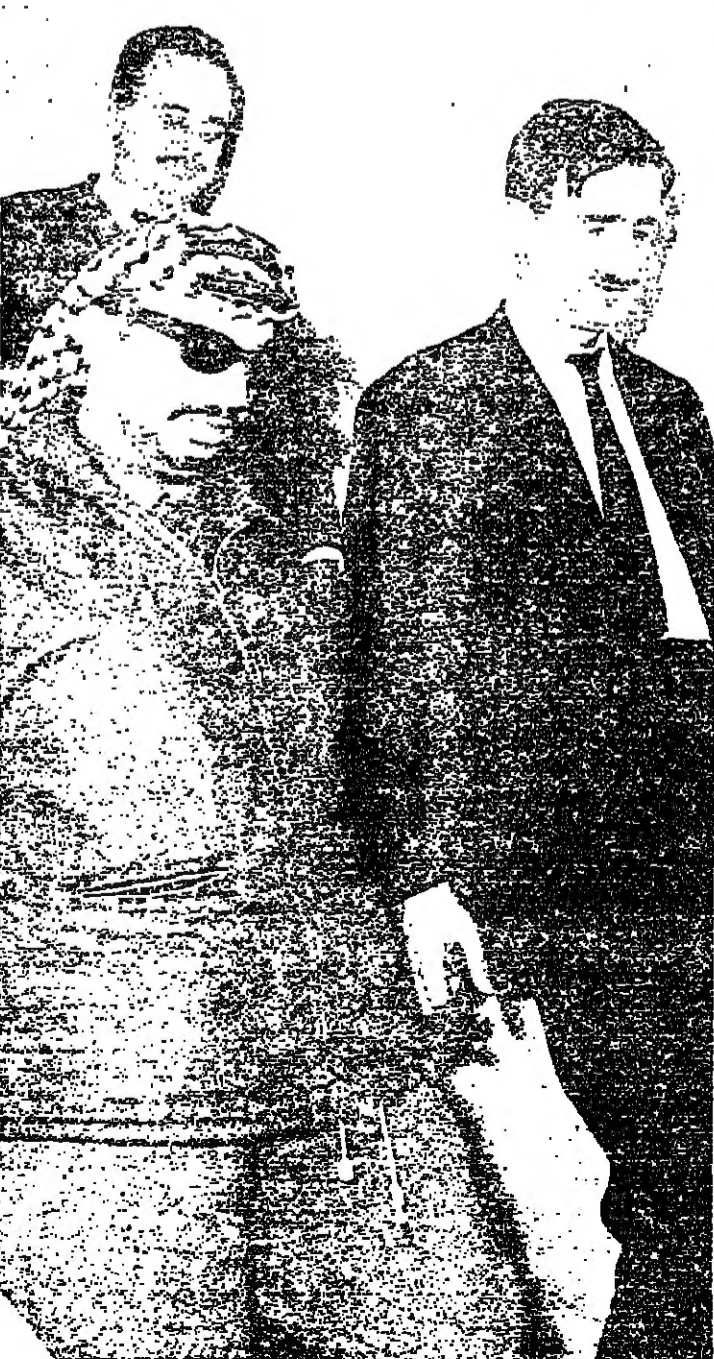
▲ في بيروت ٧٥ ■